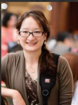
清華大學 竹師教育學院英語教育中心

안녕하세요 bonjour こんにちは Guten Tag 你好 Hello привет ciao zia salut زی سؤمى شخاي oqbo chào hola